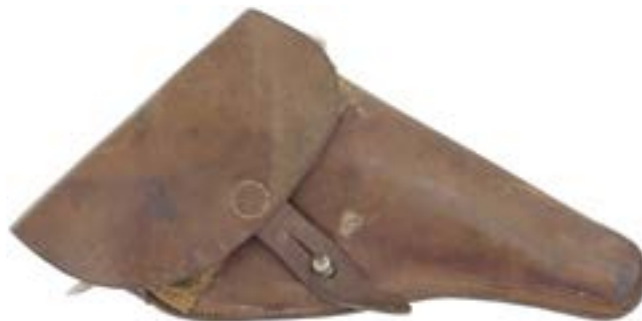
16300 CHF 80.- 234413 Futteral zu Radfahrerrevolver 1882. Braunes Leder, Leinenschlaufen für 10 Reservepatronen. Die 2 Gurtschlaufen sind im Gegensatz zum normalen Futteral schräg angenäht. Hersteller: „Bigler, Bern“, Abnahmestempel „N“. Zustand 2