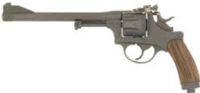
16295 CHF 400.- 238464 Revolver, Waffenfabrik Bern, Ord. 1882, Sportversion, Kal. 7.5mm. LL 186mm, TL 310mm, überarbeitete, nachbrünierte Ganzstahlwaffe mit DA-Abzug, sechsschüssig, Bedienelemente überbrüniert. Lackierte Nussholzgriffschalen mit Längsrillen. Mikrometervisier, Blockkorn. #27352 WES Zustand 2