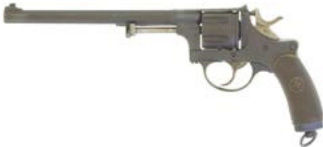
16294 CHF 480.- 238463 Revolver, Waffenfabrik Bern, Ord. 1882, Kal. 7.5mm. LL 195mm, TL 320mm, nachbrünierte Ganzstahlwaffe mit DA-Abzug, sechsschüssig, Bedienelemente gelb angelassen, resp. blank. Bräunliche Hartgummigriffschalen, Fangschnurring. Waffe wurde mit längerem, nicht nummergleichem Lauf versehen. #2144/2284 WES Zustand 2