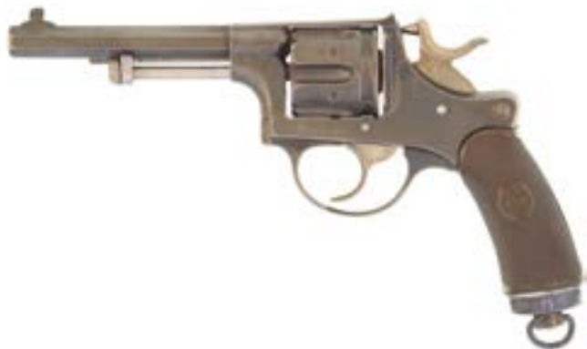
16293 CHF 400.- 223501 Revolver, Waffenfabrik Bern, Ord. 1882, 1. Serie, Kal. 7.5mm. LL 115mm, TL 240mm, brünierte Ganzstahlwaffe mit DA-Abzug, sechsschüssig, U-Kimme, Perlkorn. Bedienelemente gelb angelassen, teils blank, ohne Stossbodenplättchen, bräunliche Hartgummigriffschalen, Fangschnurring. Brünierung mit leichten Tragspuren. #180 WES Zustand 1