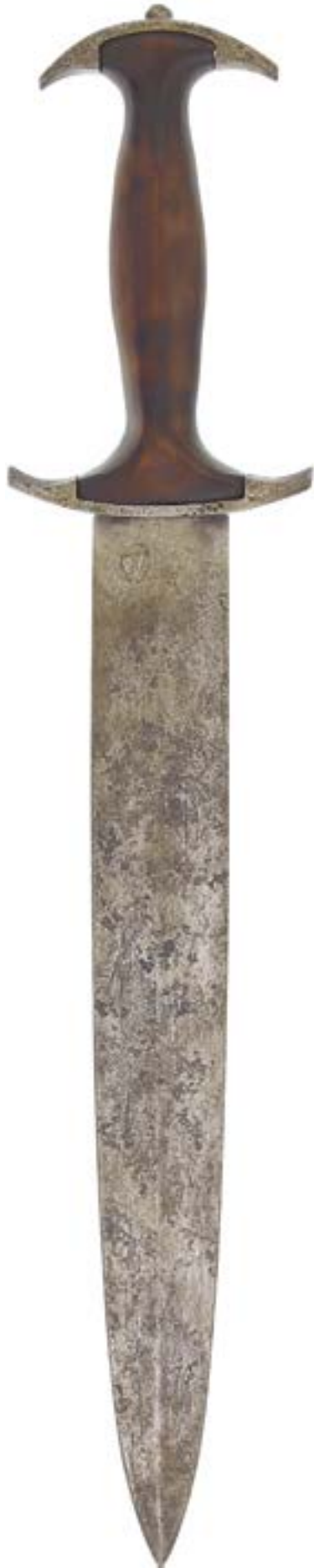
16036 CHF 1200.- 239128 Schweizerdolch 16./17. Jahrh. KL 33cm, TL 49cm, symmetrische beidseitig geschliffene Klinge mit Schmiedemarke in der Wurzel. Eiserne Parierstange und Knaufbalken, glatter Griff aus Buchsbaumholz, Eisenteile korrodiert. ANT Zustand 2

16037 CHF 1800.- 238408 Luntenschlossbüchse, 1621, Kal. 20mm. LL 1060mm, TL 1460mm, gezogener Achtkantlauf, datiert 1621. Marke auf Lauf, ähnlich Katzenkopf. Standvisier, Korn und Kimme seitlich eingeschlaucht. Längliche, flache Schlossplatte, Pulverpfanne mit eisernem Deckel, Feuerschirm. Massive Vollschaftung mit eiserner Kolbenkappe, beinerner Vorderschaftabschluss. Hölzerner Ladestock, Dopfer aus Horn. #ohne ANT Zustand 2